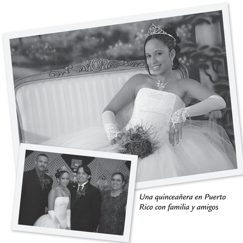
Una quinceañera en Puerto Rico con familia y amigos

En Puerto Rico, la celebración se llama el quinceañero. Muchas veces las chicas tienen la gran fiesta en su cumpleaños número dieciséis (por influencia del Sweet Sixteen ) y no en el cumpleaños de los quince años.